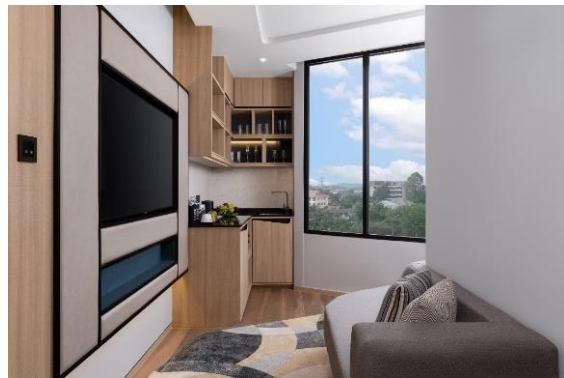
ภาพบน: โรงแรมโนโวเทล ระยอง สตาร์ คอนเวนชัน เซ็นเตอร์ ประเทศไทย