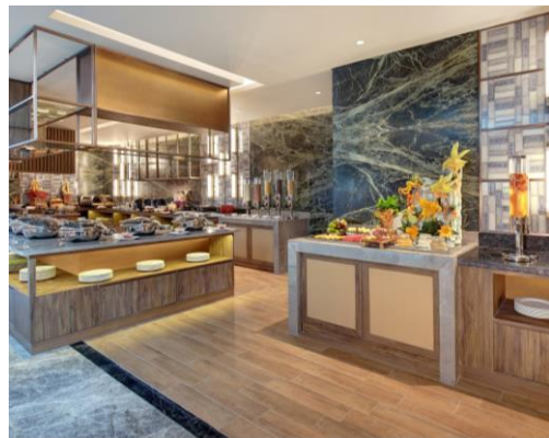
ภาพบน: โรงแรมโรงแรมเมอร์เคียว บังกอลัน นุน อินโดนีเซีย