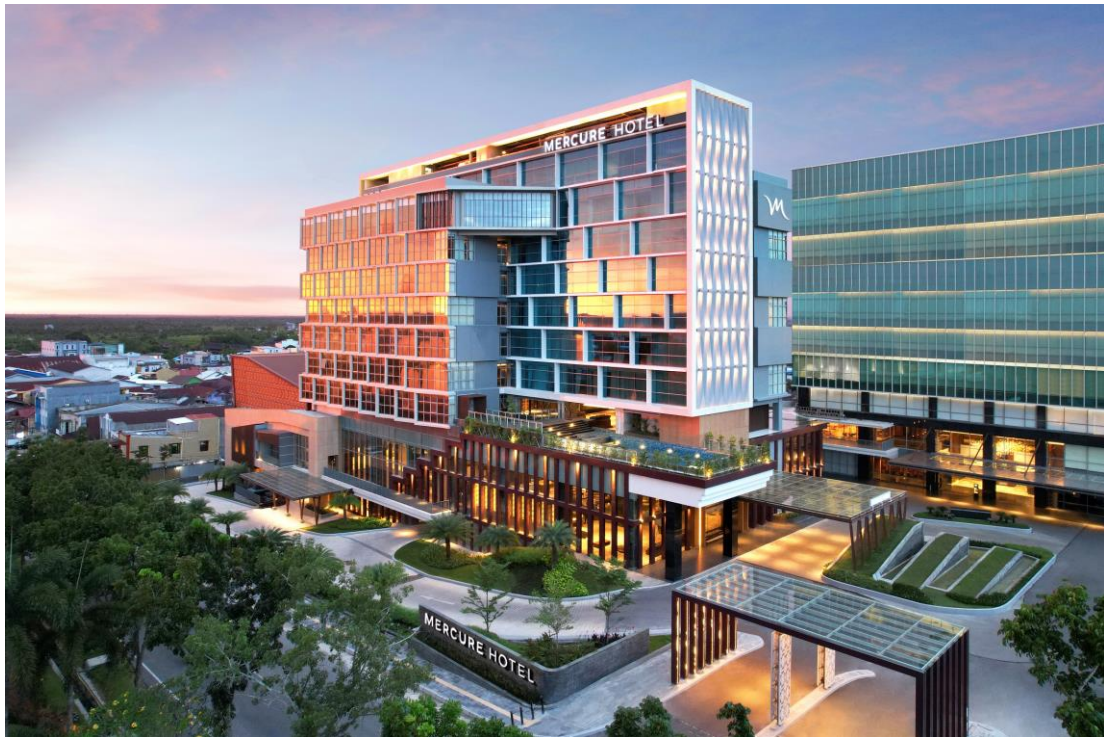
ภาพบน: โรงแรมเมอร์เคียว บังกาลัน นุน อินโดนีเซีย

ลุยขยายเครือข่ายโรงแรมระดับพรีเมียมและมิดสเกล กับโรงแรมใหม่ใน อินโดนีเซียและไทย