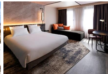
Novotel Paris Suresnes Lonchamp (rénové)