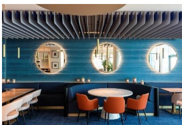
Mercure Dunkerque Centre Gare