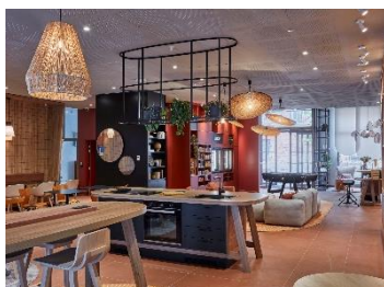
Aparthotel Adagio Toulouse Centre Ramblas