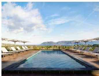
ibis Styles Porto Vecchio