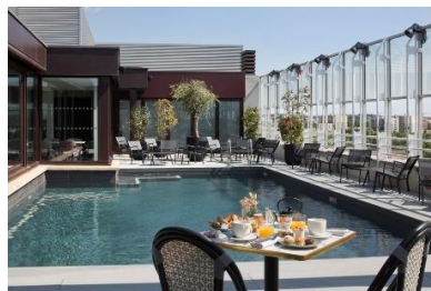
Pullman La Pléiade Montpellier (rénové)