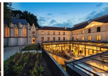
Domaine de la Reine Margot Paris Issy - MGallery Collection