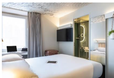
ibis Paris Nation Davout