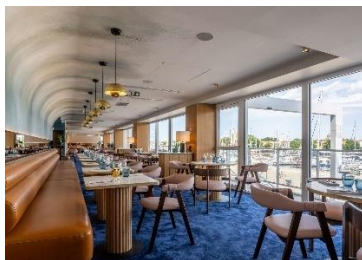
Mercure La Rochelle Vieux-Port (rénové)