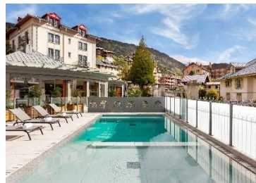
Le Saint-Gervais Hotel & Spa Handwritten Collection