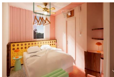
greet Pont du Gard