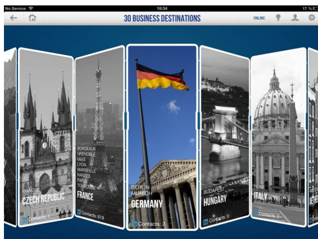
Les destinations en un clin d'œil